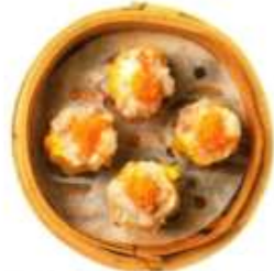
海老入りシューマイ(4) ¥1,000