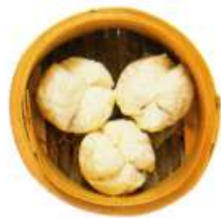
チャーシュー入り饅頭(3) ¥1,100