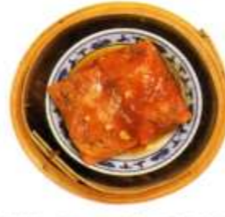
絹笠茸入り五目野菜の湯葉巻き(2) ¥1,100