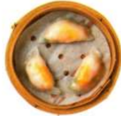
海老と野菜の餃子(3) ¥1,100