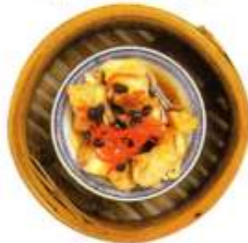
骨付バラ肉の黒豆味噌煮(1) ¥1,000

Steamed spare ribs with black bean sauce