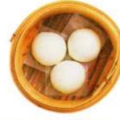
卵黄とごまの実入り饅頭(3) ¥1,000