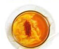
フカヒレ入りスープ餃子(1) ¥1,600

※記載価格は税抜価格となっています。(注) 写真は単品でご注文の際の数となります。