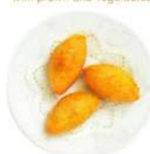
海老入りもち米の揚げ餃子(3) ¥1,100

Deep fried glutinous dumplings with prawn and vegetables