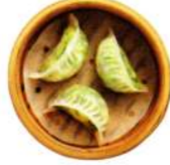
海老とニラ入り蒸し餃子(3) ¥1,100