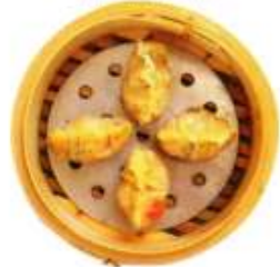
蟹肉入りフカヒレ餃子(4) ¥1,100

Steamed crab meat dumplings with shark's fin